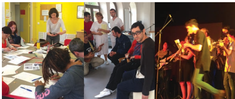
Ce trimestre a été riche en nouvelles activités, ateliers d'écriture, de percussions corporelles et de concerts.

Vous pouvez encore devenir partenaire de ce superbe projet, en bonus un film documentaire pour raconter cette formidable aventure. Si vous souhaitez en savoir plus, contactez-nous au 04 75 09 10 38 ou 06 25 36 07 35.