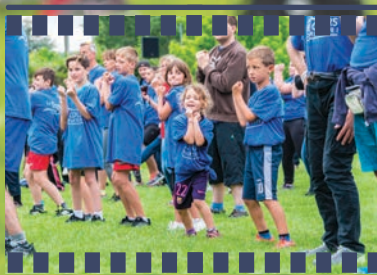
Echauffement, les enfants participent aussi...