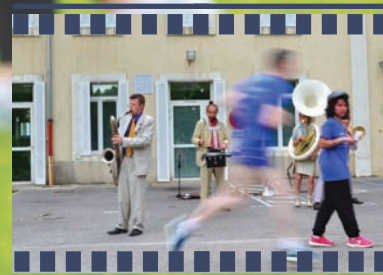
Une course en musique, avec la fanfare SopaLoca