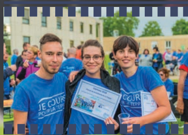
Remise des diplômes et belles rencontres