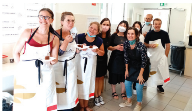
Des cours de pâtisseries offerts par les salariés de Valrhona

L'entreprise Trigano VDL assemble sur son site de Tournon des véhicules de loisir. Elle génère lors de cette activité plusieurs types de déchets : conditionnements d'emballage, chutes de production, équipements vétustes ou inutilisés, matières premières ou compo-