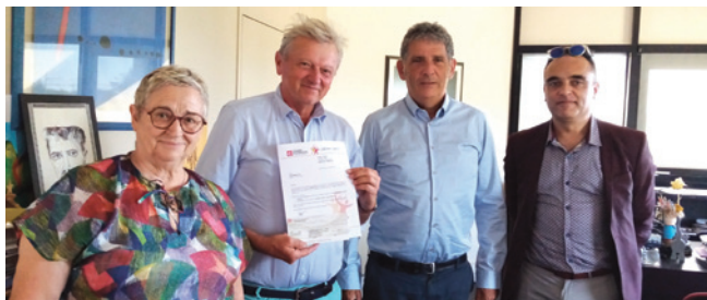
Les représentants de la Caisse d'Épargne et les président et directeur de l'Institut

Ce projet porteur d'espoir pour les patients est soutenu par la Caisse d'Épargne Loire Drôme Ardèche.